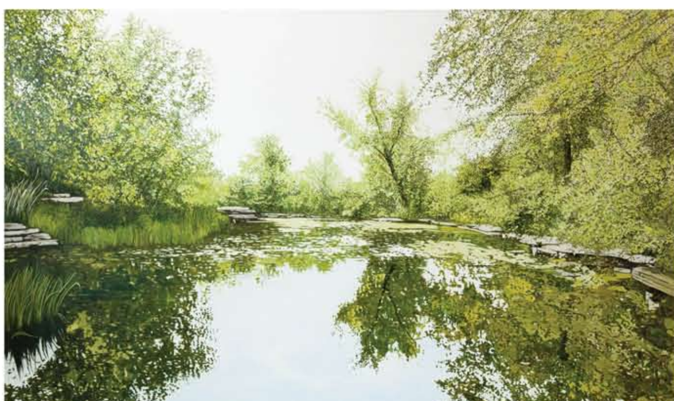
Alfred Caldwell Lily Pool (Chicago, É-Unis), 2013 huile sur toile / oil on canvas 122 x 198,5 cm