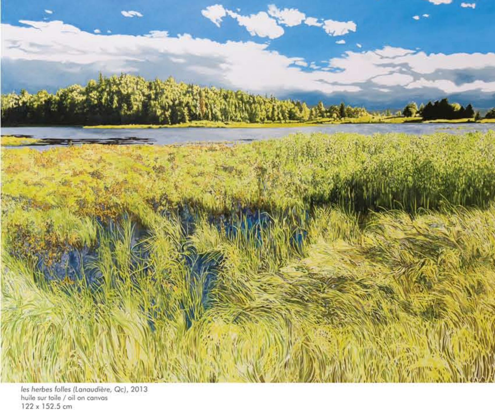
les herbes folles (Lanauillère, Qc), 2013 huile sur toile / oil on canvas 122 x 152,5 cm