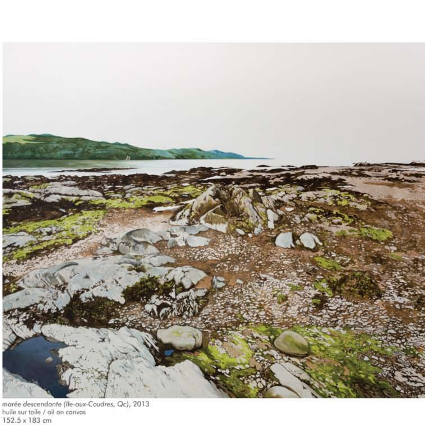
marée descendante (Ile-aux-Coudres, Qc), 2013 huile sur toile / oil on canvas 152,5 x 183 cm

PAGE COUVERTURE / COVER PAGE le fleuve me donne un moment de répit (Ile-aux-Coudres, Qc), 2013 huile sur toile / oil on canvas 122 x 91,5 cm