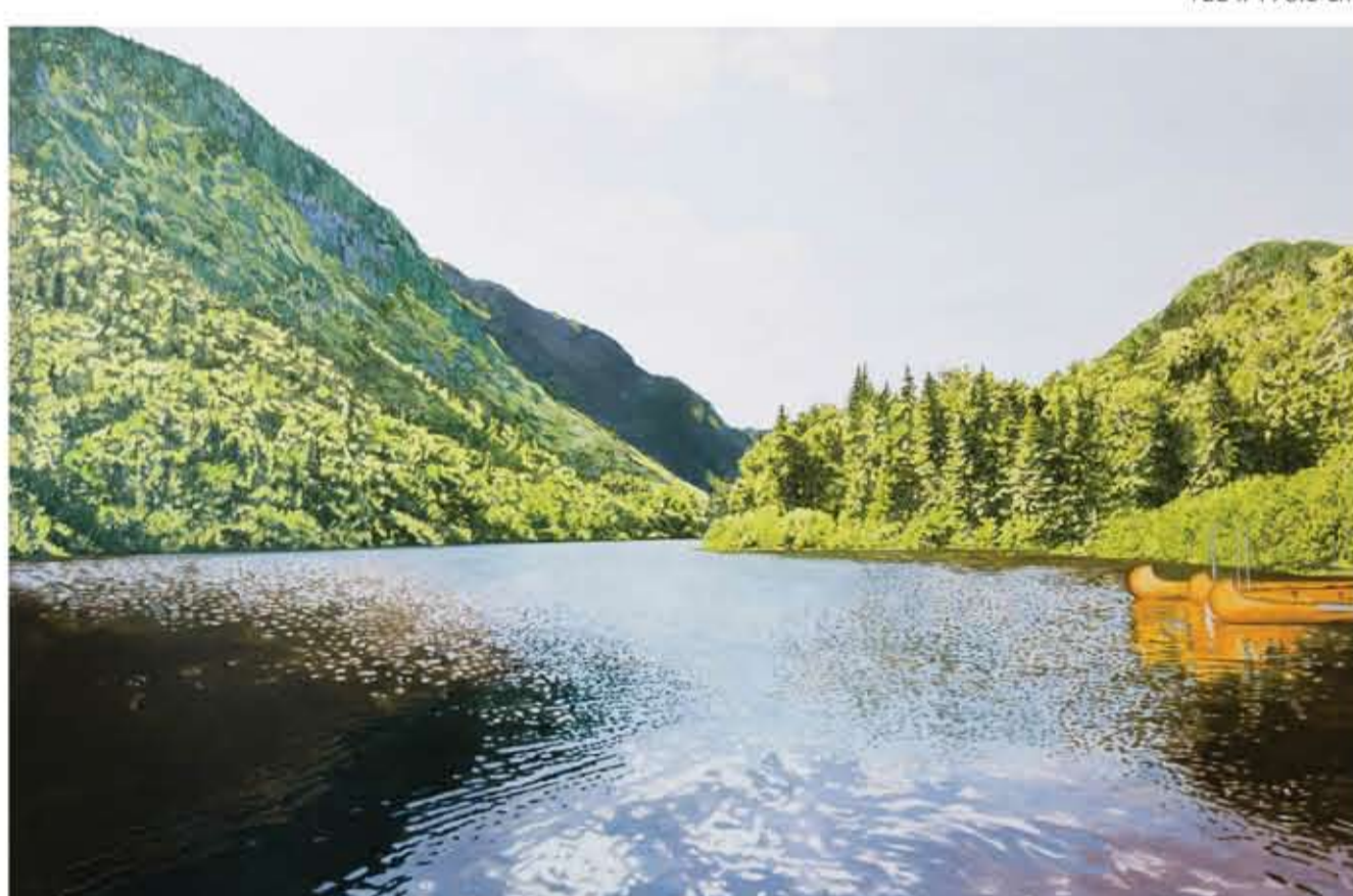
rivière Jacques-Cartier, la somptueuse (Parc national de la Jacques-Cartier, Qc), 2013 huile sur toile / oil on canvas 112 x 168 cm