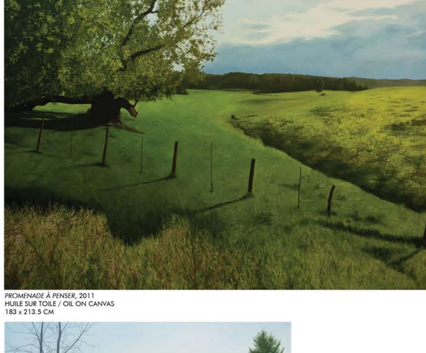
PROMENADE À PENSER, 2011 HUILE SUR TOILE / OIL ON CANVAS 183 x 213.5 CM