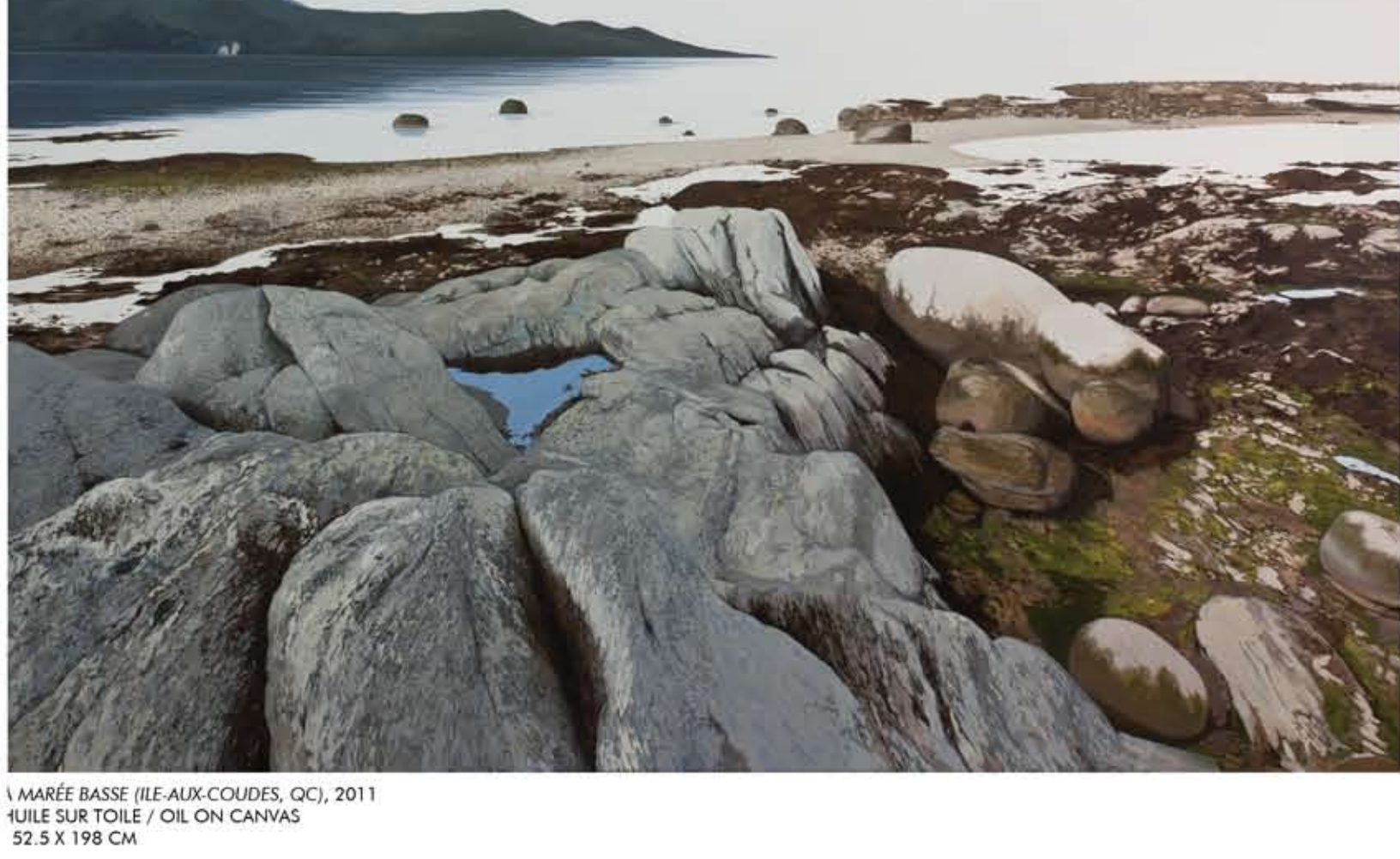
MARRÉE BASSE (ÎLE-AUX-COUDES, QC), 2011 HUILE SUR TOILE / OIL ON CANVAS 52.5 X 198 CM