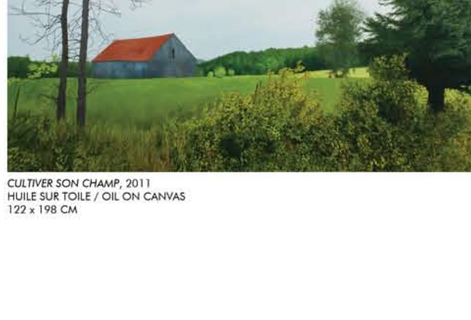
CULTIVER SON CHAMP, 2011 HUILE SUR TOILE / OIL ON CANVAS 122 x 198 CM

PAGE COUVERTURE / COVER PAGE: JE SENS LA BRISE, 2011 HUILE SUR TOILE / OIL ON CANVAS 101.5 X 101.5 CM