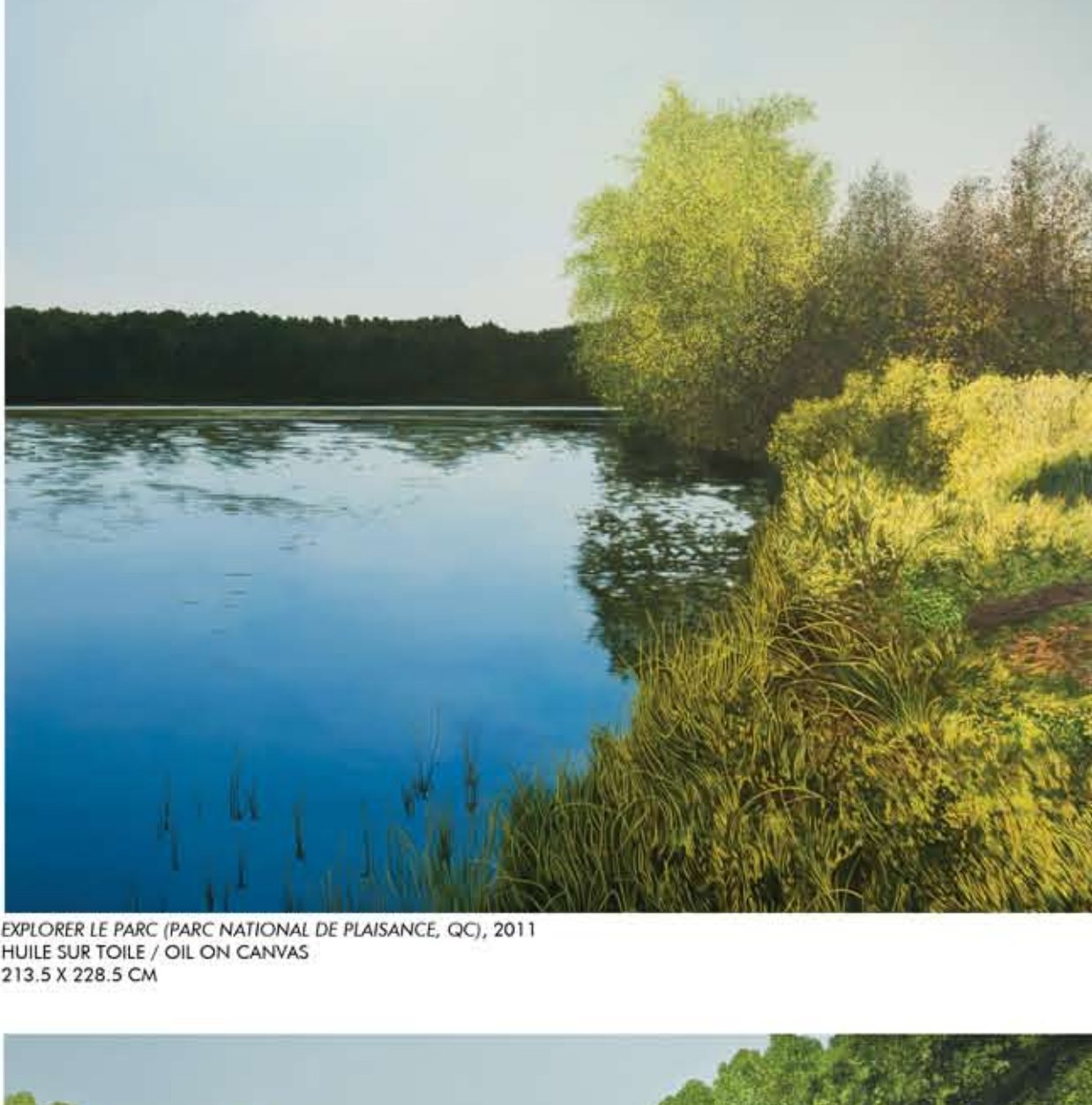
EXPLORER LE PARC (PARC NATIONAL DE PLAISANCE, QC), 2011 HUILE SUR TOILE / OIL ON CANVAS 213.5 X 228.5 CM