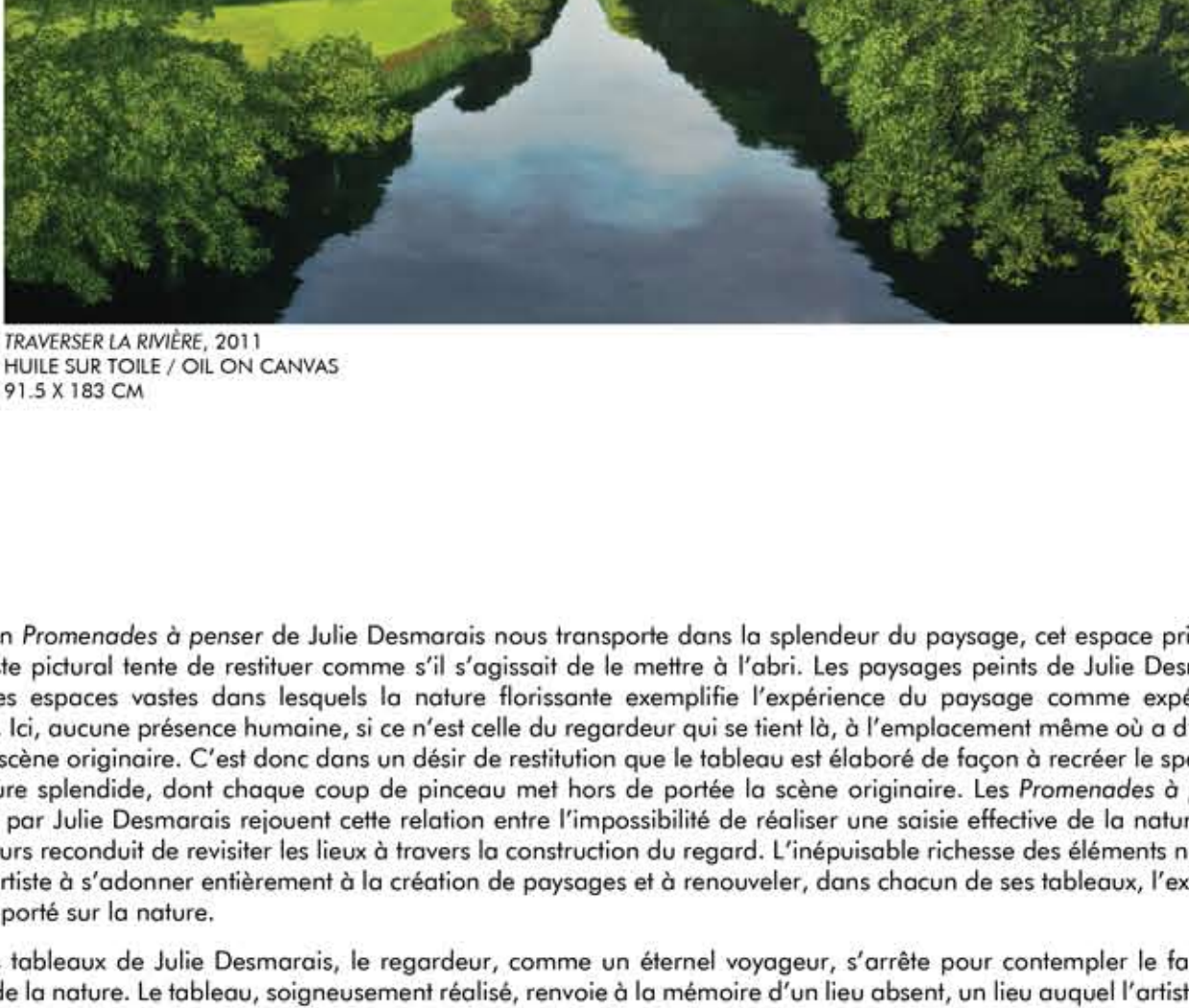
TRAVERSER LA RIVIÈRE, 2011 HUILE SUR TOILE / OIL ON CANVAS 91.5 X 183 CM

L'exposition Promenades à penser de Julie Desmarais nous transporte dans la splendeur du paysage, cet espace privilégié que le geste pictural tente de restituer comme s'il s'agissait de le mettre à l'abri. Les paysages peints de Julie Desmarais ouvrent des espaces vastes dans lesquels la nature florissante exemplifie l'expérience du paysage comme expérience esthétique. Ici, aucune présence humaine, si ce n'est celle du regardeur qui se tient là, à l'emplacement même où a d'abord été vue la scène originelle. C'est donc dans un désir de restitution que le tableau est élaboré de façon à recréer le spectacle d'une nature splendide, dont chaque coup de pinceau met hors de portée la scène originelle. Les Promenades à penser proposées par Julie Desmarais rejoignent cette relation entre l'impossibilité de réaliser une saisie effective de la nature et le désir toujours reconduit de revisiter les lieux à travers la construction du regard. L'inépuisable richesse des éléments naturels conduit l'artiste à s'adonner entièrement à la création de paysages et à renouveler, dans chacun de ses tableaux, l'exigence du regard porté sur la nature.