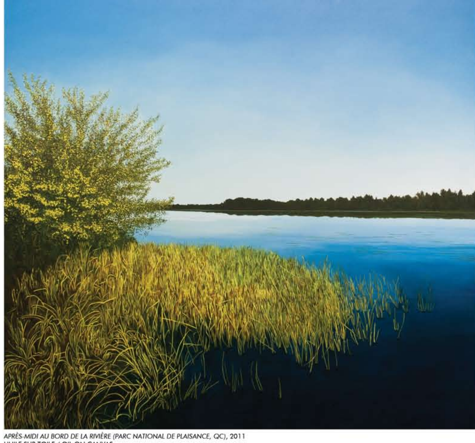
APRÈS-MIDI AU BORD DE LA RIVIÈRE (PARC NATIONAL DE PLAISANCE, QC), 2011 HUILE SUR TOILE / OIL ON CANVAS 183 X 183 CM